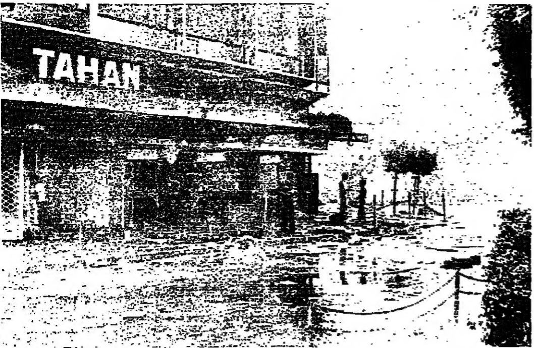
جانب من أحد شوارع طرابلس الرئيسية أمس